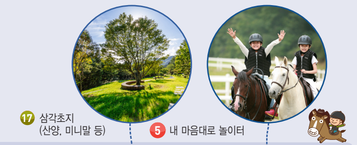
17 삼각초지 (산양, 미니말 등)