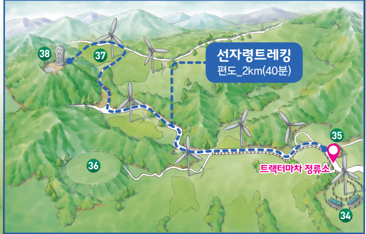
<선자령트레킹 코스 확대 지도>