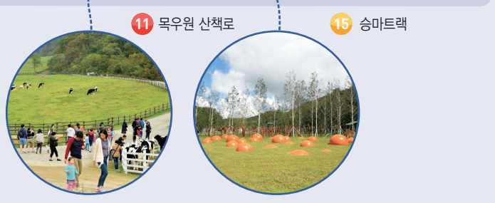
11 목우원 산책로