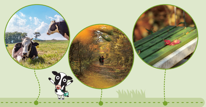
23 24 앞등목장(젖소, 말)